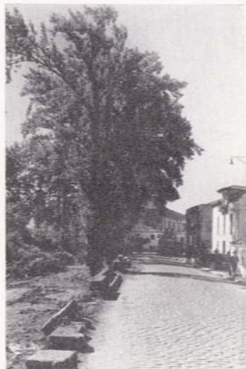
Avenida Rafael Gasset

Referencias interesantes, son también las que hace esta obra a dos romerías. La primera, la del Socorro —ya extinguida— que tenía lugar en Agro Novo, parroquia de Seira. El ambiente parece que estaba bastante animado, pues Barros dice que cerca de la ermita —hoy en ruinas— se encontró "algunos grupos de aldeanos, el infatigable gaitero con