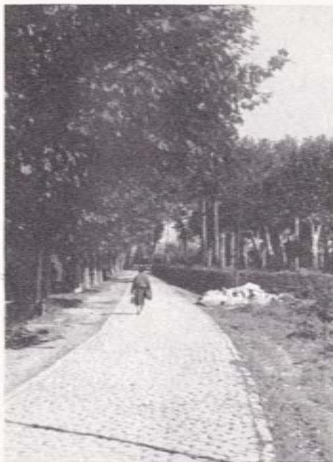
Camino de tras do Xardín

El otro personaje parece que no era de perfil tan grato. Se trataba —según se verá— de un clásico "rompetechos", empleando una calificación típicamente padronesa. Se le conocía por el sobrenombre de "Lamprea", un tipo de "oji-