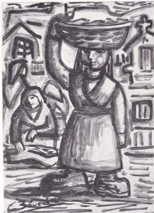
PEIXEIRAS DA MIÑA TERRA (Ilustración del pintor padronés Carlos Bóveda)