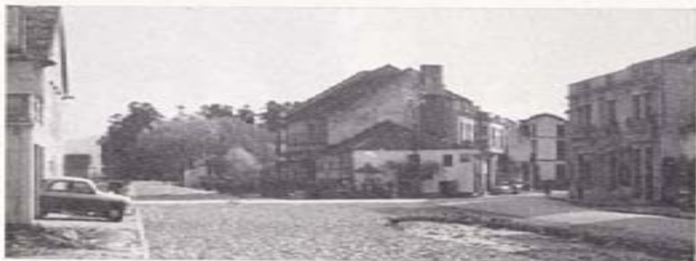
Avenida Rafael Guzmán

"Fue aquella la primera vez que hablé con ella —dice— si bien la conocía de vista hacia ya largos años. Nos recibió en su gabinete de trabajo, templo de las Letras y las Musas, sin más adorno que una modesta mesa escritorio, algunas sillas y una extensa estantería, repleta de libros, que ocupaban los cuatro lados de la habitación. Hablamos de diversos asuntos: de América, de Galicia, de Literatura, de la gloria y la fortuna. Su palabra lítil y simpática, su gracejo natural y de buen gusto, en que se des-