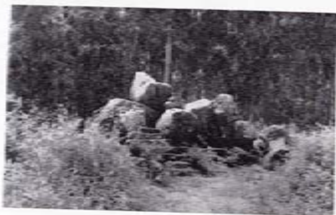
Peñas donde predicó el Apóstol Santiago.

como si en algún tiempo fuera behetría. Lestrove, más a lo caballero, sube al Carballedal y respira a sus anchas o se refuerza como hierro en forja. Me parece siempre que Lestrove se somete humilde a la esclavitud, como si una gran fuerza le llevase a arrojarse en los mismos brazos de Padrón, que ha visto en los lestrovenses gente de hisbaana. Lestrove, cenicienta, triste, sola, vuela sobre sus pasos, más allá de la fuente y el Palacio. Por eso es un núcleo con raíces vivas de independencia.