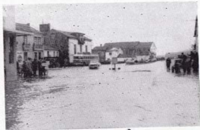
Cuando ya las aguas, por su retirarse, lo permiten, las gentes dejan sus casas para ver cómo los coches quedan bloqueados

Teléfono (Antequeira, 6) — R O I S (Padrón)