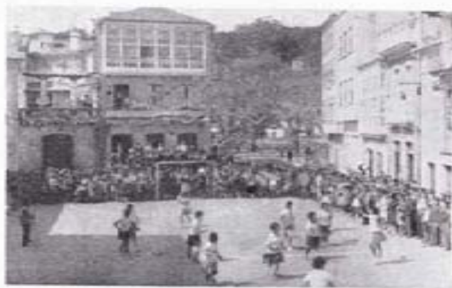
Un rincón de la nueva plaza de Macías, antes del Hilado