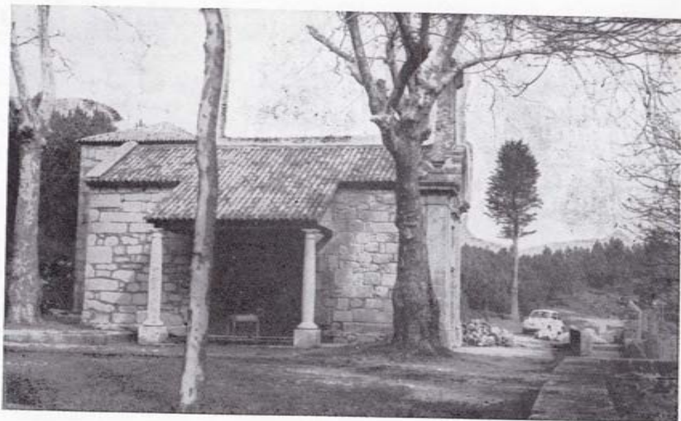
Capilla del Santiaguino, donde se celebra una concurridísima romería el día del Apóstol Santiago