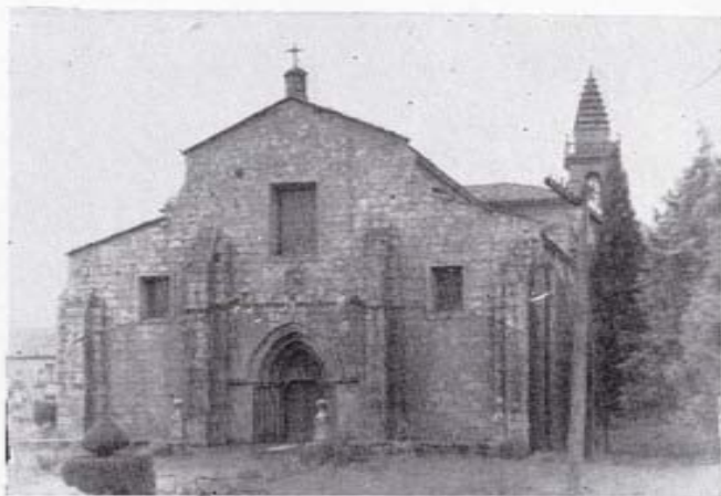
Actual iglesia parroquial de Iria, que fue la catedral más antigua de España, y se construyó sobre el templo mariano más antiguo del mundo.

falta que vuelva Rosalía y contemple la lluvia fina y menuda, que viene del Ulla y se va tras los montes. Y que por un conjuro del destino esa lluvia mojase por estival ocasión agosteña, el manto de la Afligida Virgen de Lestrove.