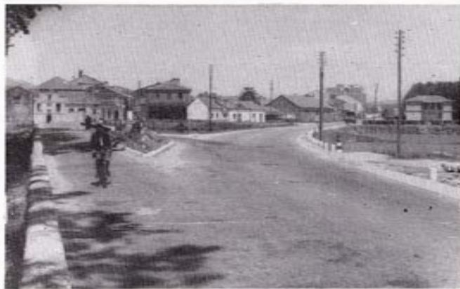
Entrada norte de la villa