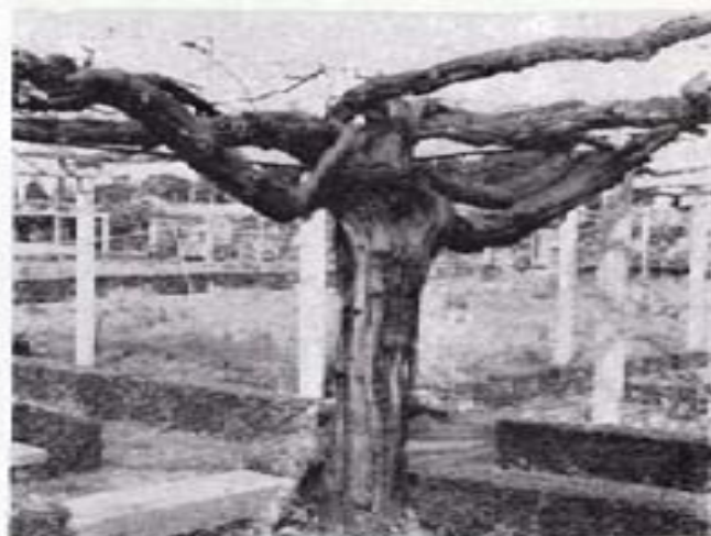
Pie de parra, el mayor del mundo. En 1944 produjo 2.000 (dos mil) litros de vino. Se encuentra en los terrenos de PICUSA y fue visitado especialmente por el Caudillo

nessas adobadas de lluvias. ¡Pero las conveniencias sociales...! Cuando el Ulla desciende de la alta cuenca se va enojando de sazonados limos, de una fauna y flora fertilísimas que abonando aguas y llanada, son