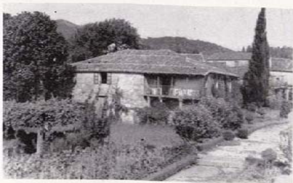
Casa donde murió Rosalía de Castro