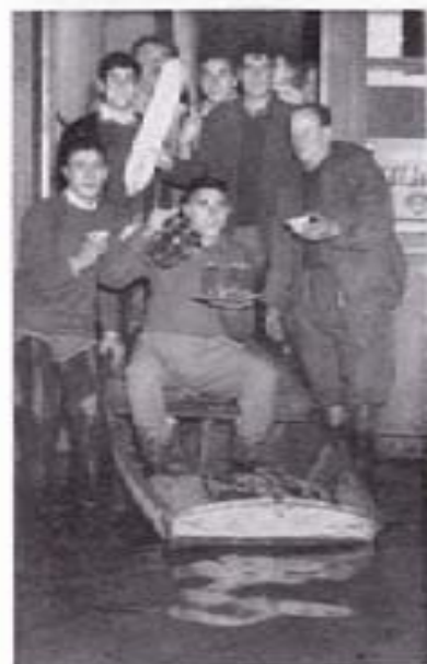
Marineros improvisados y "chapunones" hacen alto ante una fuente para refrescar la garganta