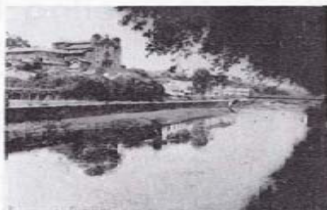
El río Sar cuando por sus bajas aguas no anuncia inundación

—Mi letra es la Q, sillón es el que venimos tres pallepos seguidos; Lineres Ricos, de Santiago; el Almirante