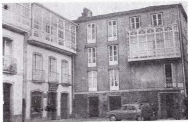
Un rincón de la plaza de Baltar