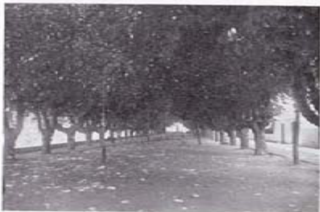
El maravilloso Paseo del Espolón, único en España

Pero yo sé que estare. Sé que llevo algo de aquellas piedras por mi sangre, aquí, donde termina el hombre y vive el santo... Es él. Estoy segura.