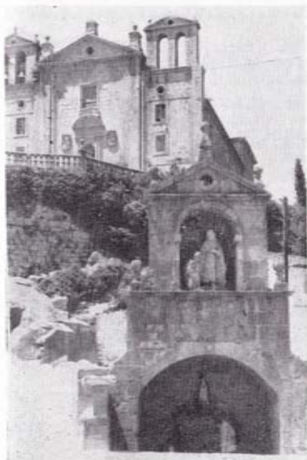
Iglesia y Fuente del Carmen