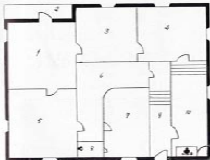
Croquis de la casa de la Mantanza en donde murió Rosalía de Castro.

En el huerto hay un cerezo y un laurel que se suponen, fundadamente, del tiempo de Rosalía; y una especie de cenador, con mesa y banco de piedra, en el que ella gustaba de escribir.