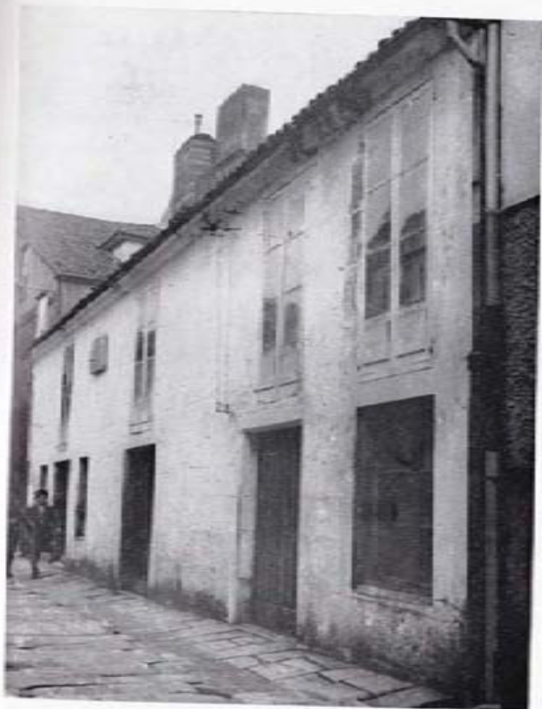
Casa n.º 4 de la calle de Juan Rodríguez.