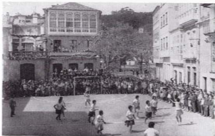
La plaza de Macías durante la celebración de un acto deportivo.

La Plaza de Macías es también una plaza musical, pues en ella se celebran los conciertos que se programan para amenizar las principales fiestas de la villa. En su ámbito, cualquier obra alcanza resonancias triunfales, especialmente cuando los platillos chocan con violencia. Y si bien es cierto que la melomanía es una tendencia muy