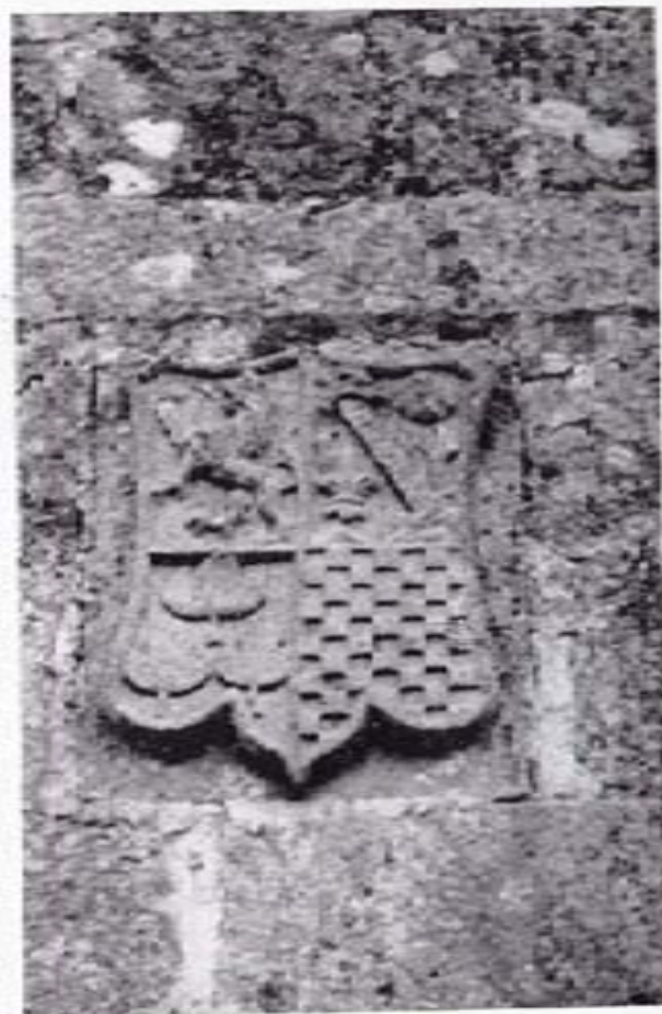
Armas de los Figueiredos.

cuartel con tres hojas de higuera, una de las brisuras—o formas—de Figueiredos y, ciertamente, la menos corriente, ya que lo normal