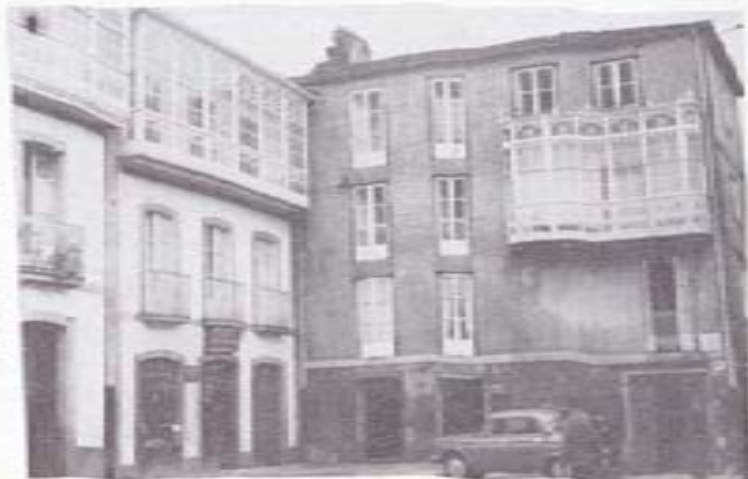
Plazuela de Baltar.

Prueba de lo que decimos: fue la ilusión que pasó siendo Director de aquel Centro, en intentar una importante reforma del mismo. Sofista, en efecto, que el Gran Hospital llegaría a estar dotado de todo género de elementos para que los enfermos estuvieran perfectamente atendidos y para que los médicos disfrutaran de la satisfacción interior que da el saber cubiertas todas las exigencias científicas. La institución estaría regida por un Patronato de hombres eminentes y dignos y en ella se centraría la lucha regional contra el cáncer. Pero,