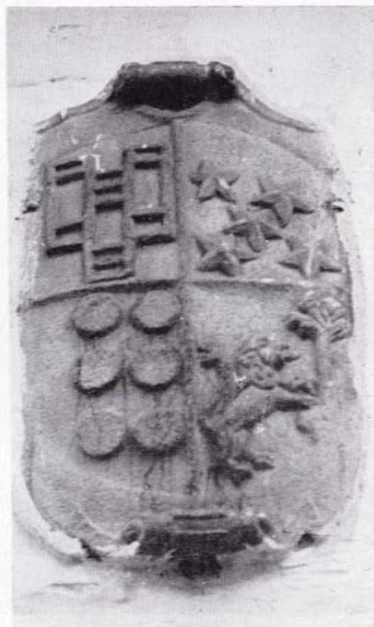
Escudo de los Castro, en Fondo de Vila.