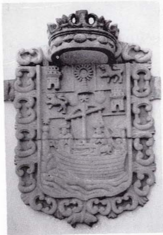
Escudo combinado existente en la "Caseta de la luz".

Este mismo escudo, se repite en la fachada del Ayuntamiento de Padrón. Ambos son barrocos y las variantes que acusan son de formato, si bien al de la Casa Consistorial le falta la alusión a Galicia y al Reino castellano-leonés.