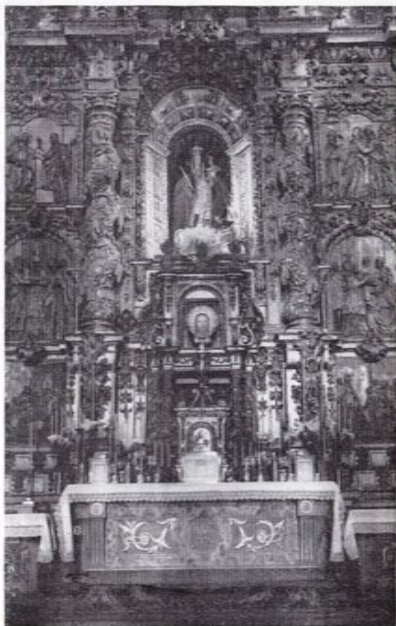
Altar Mayor de la Colegiata de Iria-Flavia

lado del Santo Cuerpo del Apóstol Santiago, del cual una representación pictórica de la escena nos la enseña un cuadro de autor anónimo, hoy en el Museo del Prado.