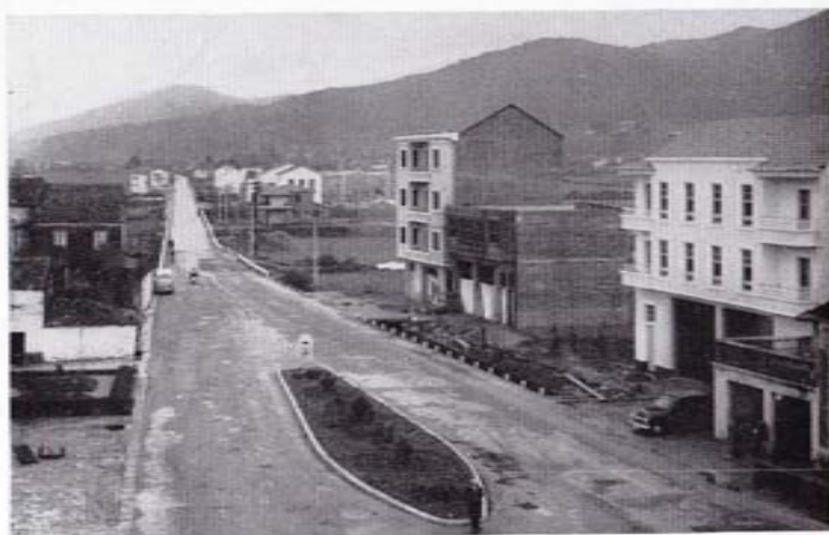
Un aspecto del Padrón moderno y progresivo.

Como modesto homenaje a su memoria, a los dos años de su fallecimiento, insertamos en este programa de Pascua dos de sus composiciones, en las que son ostensibles las características que apuntábamos: su tono reciamente viril y su amor a Padrón.