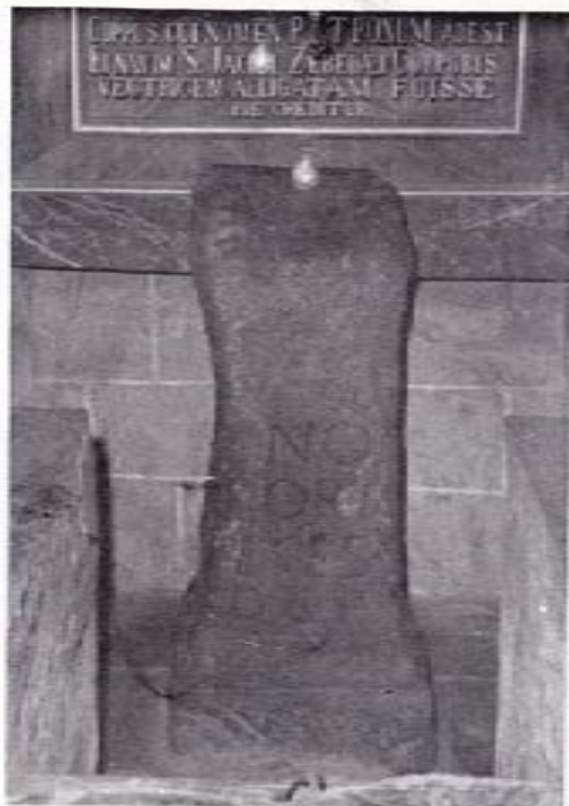
Padrón, donde ataron la barca que traía los restos mortales del Apóstol Santiago y que se conserva debajo del altar mayor de la iglesia parroquial.