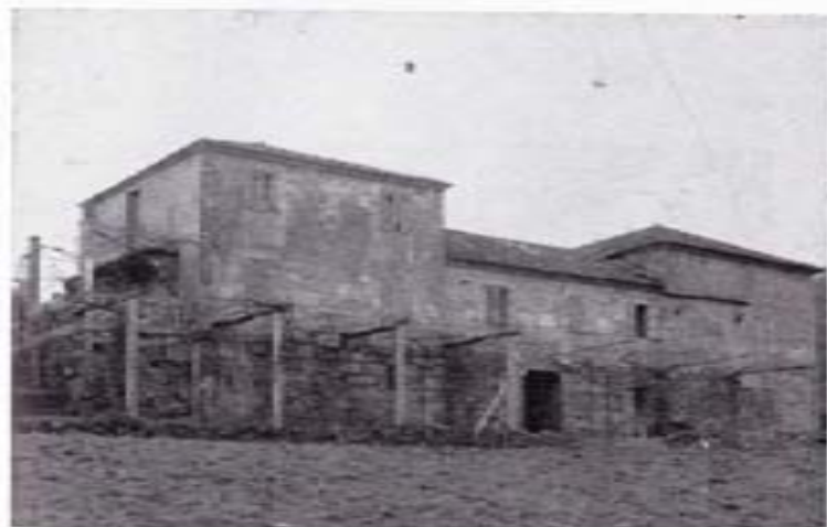
Torre de Hermida.