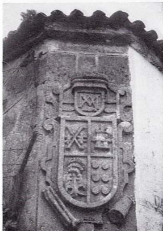
Escudo de los Castros, en Murgadán.