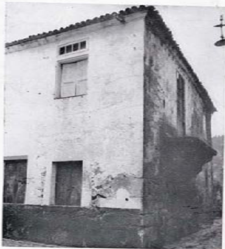
Casa dos Castros — Calle Murgadán.