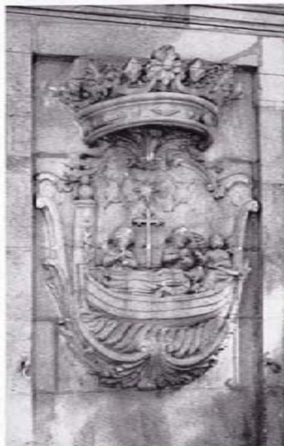
Escudo de la Villa.

Nosotros hemos traído a estas páginas solamente una breve selección de escudos de armas. Ofrecer todos, resultaría impropio de un programa de fiestas. Sin embargo, creemos que la muestra es suficientemente elocuente y prueba, sin género de duda, que nuestro pueblo tuvo destacada importancia en el desarrollo y avatares de las Casas solariegas que, en su tiempo, fueron las clases rectoras de toda la sociedad gallega.