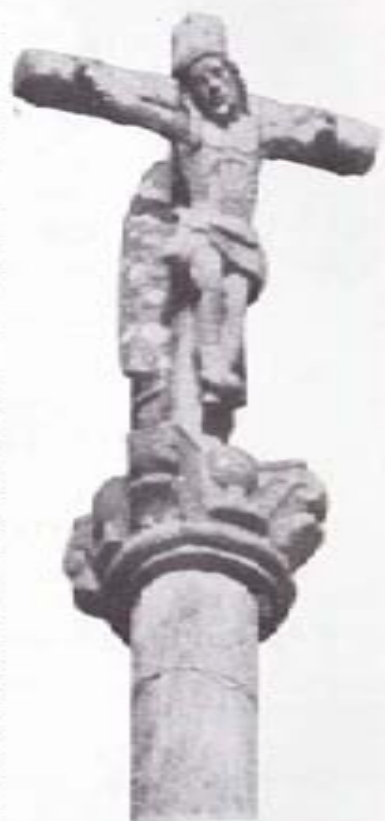
CRUCERO DE ARRETEN

Para agotar el censo de cruces en la parroquia de Sta. María de Iria, nos referiremos, finalmente, a dos que podríamos llamar «del tráfico», ya que se encuentran en el mismo margen de la carretera general. Es uno el Crucero de Patricia, que se alza al pie de una casa así conocida en el lugar de Quintáns (Pazos). Sólo muestra dos gradas, ya que las restantes—hasta cinco o seis, que es lo corriente—están enterradas y, en el pedestal, hay como una oquedad que perteneció—eso creemos—a lo que en el preterito fue un «peto de Animas». El fuste presenta un «santiño», en