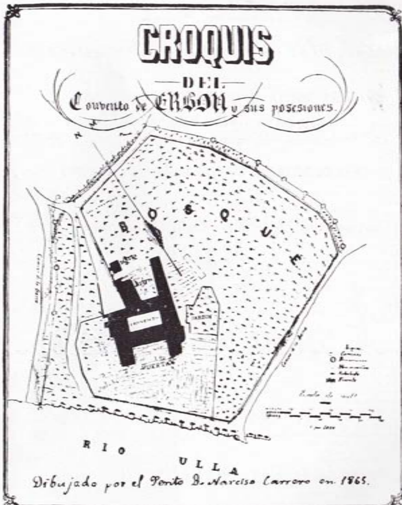
Plano del Colegio de Herbón