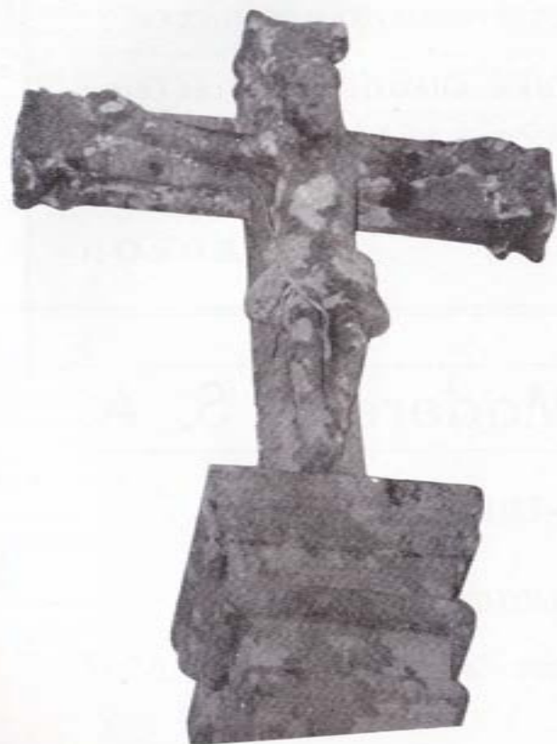
CRUCERO DE SAMIL

Dejando a un lado el Cruceiro da Veiga—ya en Santa María de Dodro—se llega al Cruceiro do Souto, queo cu-