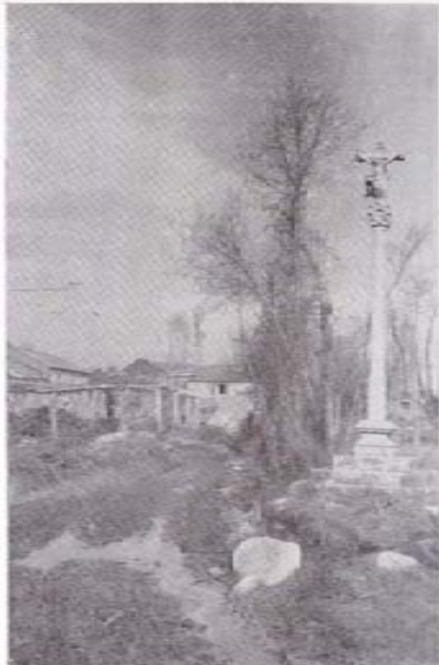
CRUCERO DE PORTA DOS MARINOS