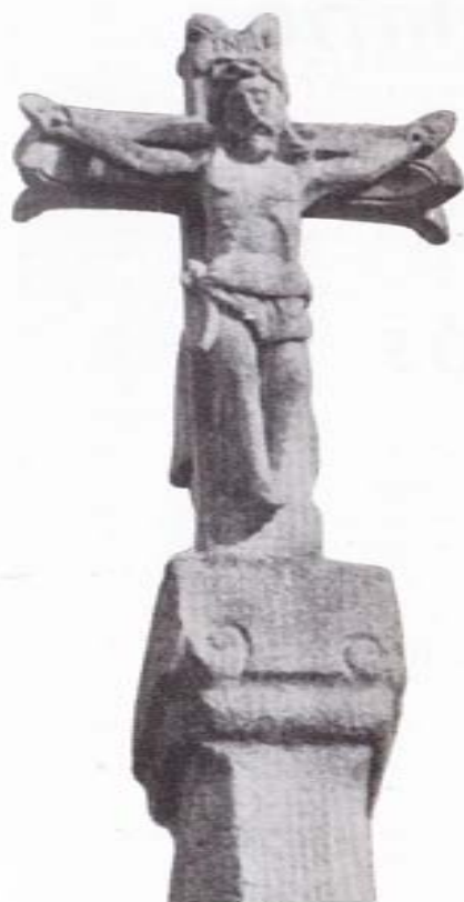
CRUCERO DE XUANE (CARCACIA)

el que es posible identificar a San Francisco, sacando Animas del Purgatorio con su milagroso cordón. La figura del Crucificado resalta en gran relieve, completándose la cruz, al otro lado, con la imagen de la Virgen de las Angustias. El capitel está muy trabajado y contiene querubines y ornamentos florales. El otro crucero es el de Porta dos Mariños, que data del final del XVII; éste se rompió y, en el año 1960, fué solememente bendecida una fiel reproducción que realizó el ya mencionado Sr. Sanmartín. En la cruz, que es de imitación vegetal, Cristo agonizante recibe el abrazo de San Francisco, mientras en el reverso la Virgen es coronada por dos ángeles. El capitel, trabajado esmeradamente, además de los acostumbrados adornos, contiene la Custodia y tres cabezas de angelotes y el fuste, octogonal, refiere los instrumentos de la Pasión. Este crucero, el último de la feligresía, es de auténtico mérito y se nos antoja que en ésta su segunda edición fué considerablemente mejorado por el escultor de Calo.