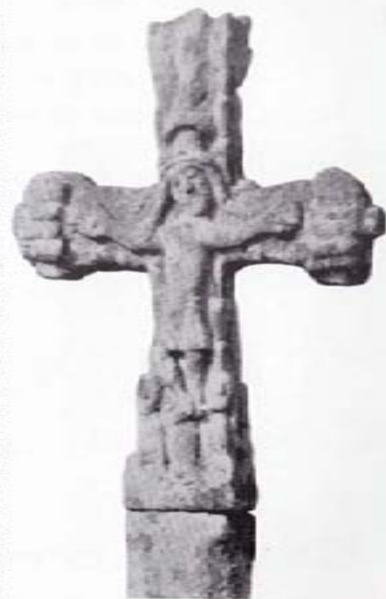
CRUCIFERO DE FRANCOS

La expansión de los cruceros en Galicia, a partir del siglo XVII, tuvo por principal motor la devoción que nuestro pueblo sentía por sus muertos queridos. Los potentados mandaban