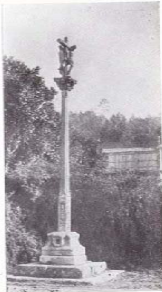
CRUCERO DE PATRICIA

embargo, las simbólicas calaveras en los esquinales del pedestal y una inscripción ilegible en la base. No obstante, se trata de una pieza de gran mérito, en cuyo reverso presenta a la Virgen con el Niño en brazos, dando la espalda a un Cristo, fino y lanal, y en la vara dos «santiños».