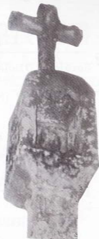
CRUCERO DA COSTA