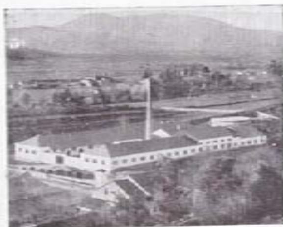
FABRICA DE LA MATANZA

Filial de: CURTIDOS ZARAGOZA, S. A. "CURTIZA" - BARCELONA