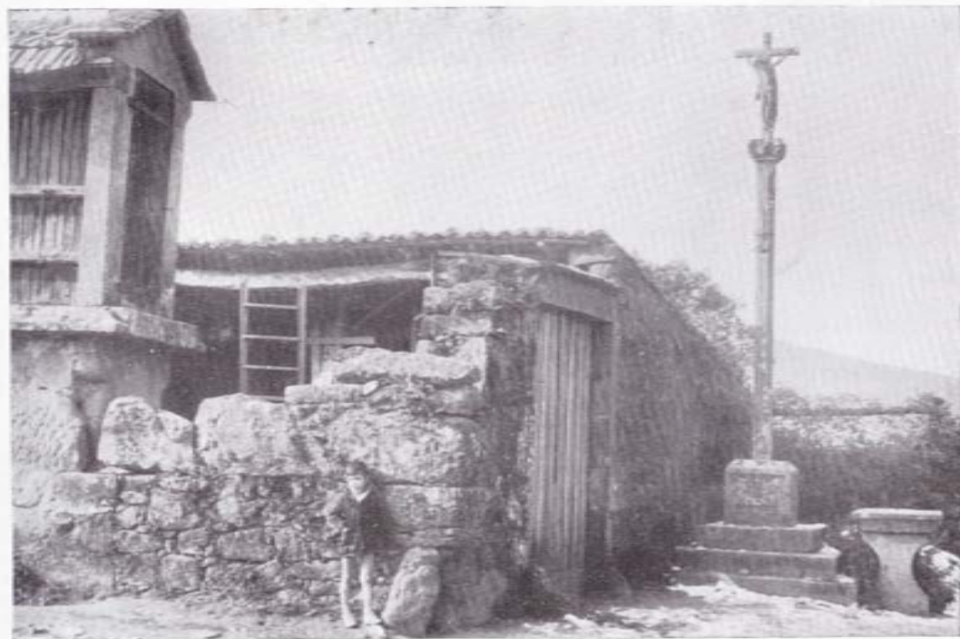
CRUCERO DE PEDREDA

La parroquia de Santa María de Iria Flavia es la que posee más cruceros, en consonancia con su extensión y la gran importancia que tuvo en el pasado. Son trece los que contamos, si bien dos de ellos están incompletos, ya que únicamente conservan la talla de la Virgen sobre el fuste y, de otro, se mantiene solo en pie la vara.