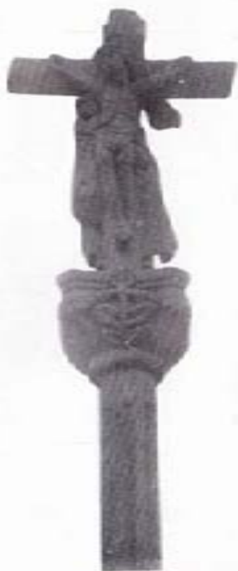
CRUCERO DEL SOUTO (LESTROVE)