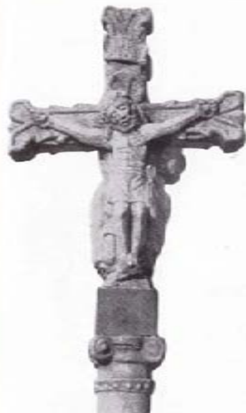
CRUCIFERO DE LINGAÉS

agradecer algún favor del cielo; deslindar villas, feligresías u otras jurisdicciones; proteger campos de feria y librar de hechicerías al ganado; servir de «ría-cruz» en los monasterios, conventos e iglesias; satisfacer penitencias reparadoras de ciertos pecados; guardar