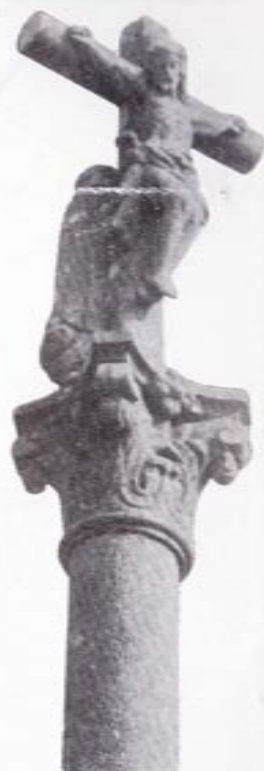
CRUCERO DE LOUREIRO