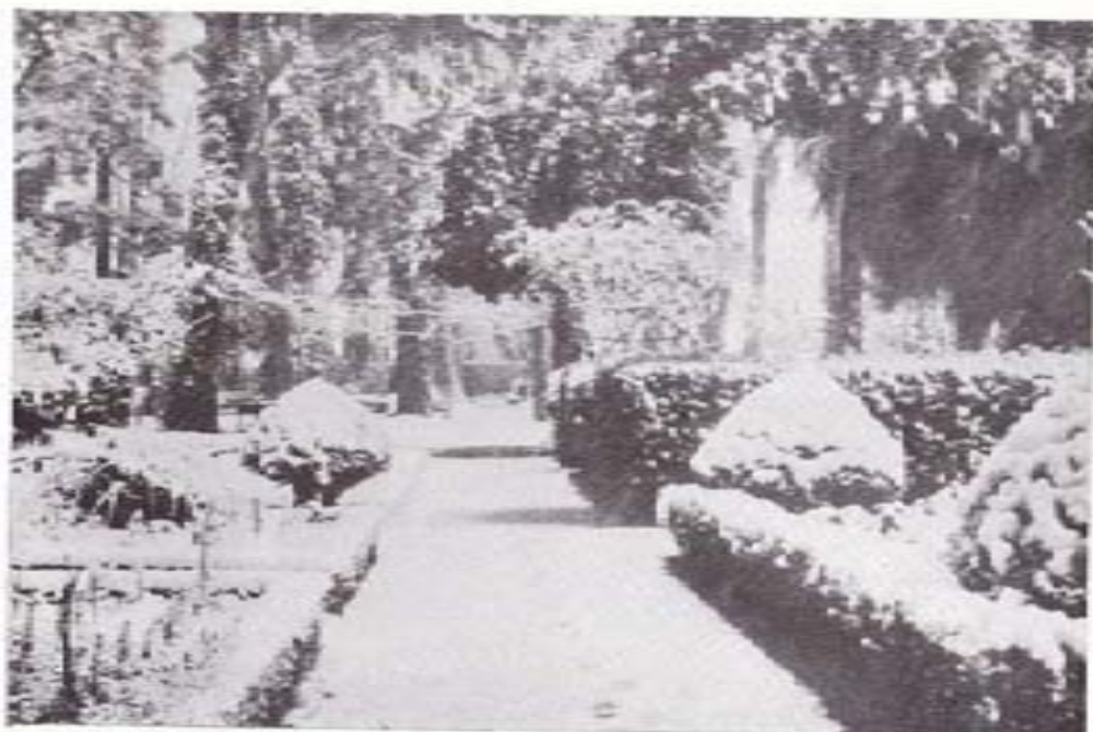
UN RINCÓN DEL JARDÍN UN DÍA DE NEVADA

Presidente del Consejo Cultural de Padrón