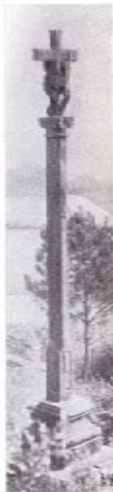
CRUCEIRO DE FRANCOS

Pero por fortuna, no llueve, sino que, por el contrario, luce un delicioso sol invernal y, desde el alto de Beto, se contempla, en perspectiva panorámica, bajo sus rayos luminosos, la gloria del Ulla, deslizándose con perezosa calma hacia la benévola Catoira, la de las Torres gelmirianas. Frente a la maravilla del paisaje, dos cruceiros bendicen la tierra y el agua. Uno, en el punto conocido por As Escuzas, al final de la costa de Beto y, otro adentrado en el camino de Teago, aunque muy cerca del anterior. El primero es un cruceiro sencillo, con la talla de San Antonio en la columna; el segundo, llamado de Ignacio, es recuerdo de un rico labriego de estos contornos, que lo mandó construir por su devoción, ofrece la singularidad de representar a