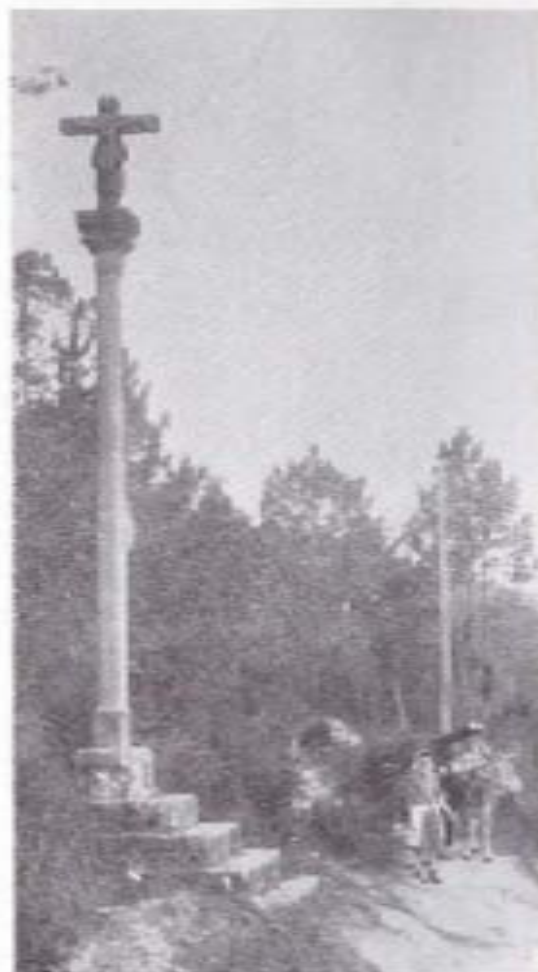
CRUCEIRO DE AS ESCUZAS