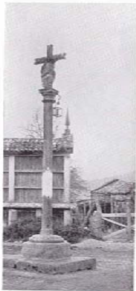
CRUCERO DEL SOUTO (REVILLOS)

Cristo con una mano desclavada — caso único en este «vía-crucis» iriense—. Probablemente su autor quiso realizar una versión del Descendimiento, muy modesta, desde luego, porque faltan los personajes acostumbrados en este caso. En el capitel se distinguen cuatro cabezas que quizá aluden a los Evangelistas.