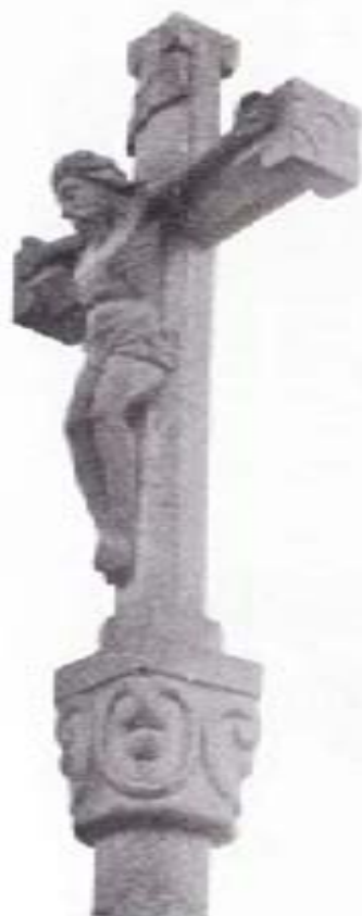
CRUCERO DEL PUENTE

Mejor suerte, en este sentido, es la que ha correspondido a los dos hermosos cruceros del cementerio de Adins, presidiendo el augusto silencio de las tumbas y celebrados por el goce de los mirlos entre los cipreses. Uno se alza en el centro de los enterramientos, sobre una plataforma de cuatro gradas. La vara es lisa y la cruz adopta forma de tronco, con un crucifijo en gran relieve y realizado, según parece, con independencia del resto. La Virgen se apoya en una peana, que descansa sobre la cabeza de un ángel y el capitel, cuidadosamente labrado, tiene cuatro querubines. El autor de esta obra posee, indudablemente, sentido de las proporciones y de los volúmenes y, a la belleza del conjunto, colabora eficazmente el prestigio poético del cementerio en que reposaron los restos de Rosalía. El otro crucero está detrás del ábside de la iglesia y en él son visibles las huellas del tiempo y los efectos de la erosión. Se advierten, sin