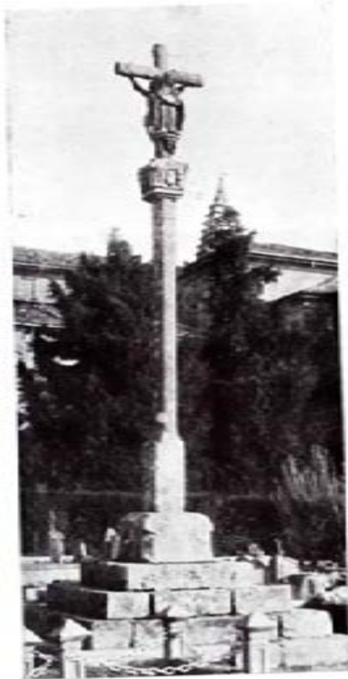
CRUCERO DE JIRNA

El Crucero de Fondo de Vila está a la entrada de Padrón, según se viene de Pontevedra.