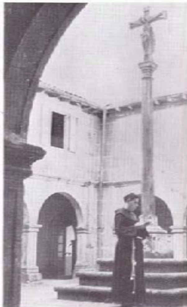
Prospectiva del patio del Colegio de Misioneros