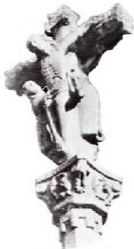
CRUCERO DE HERDÓN

construir monasterios, conventos, capillas o iglesias para la salvación de sus almas; la gente modesta, ergula cruceros. Un crucero era una oración petrificada, a perpetuidad, que se aplicaba en sufragio de las almas. Los cruceros, en fin, son templos construidos por el pueblo gallego, bien por manda testamentaria o por precaución de pecadores.