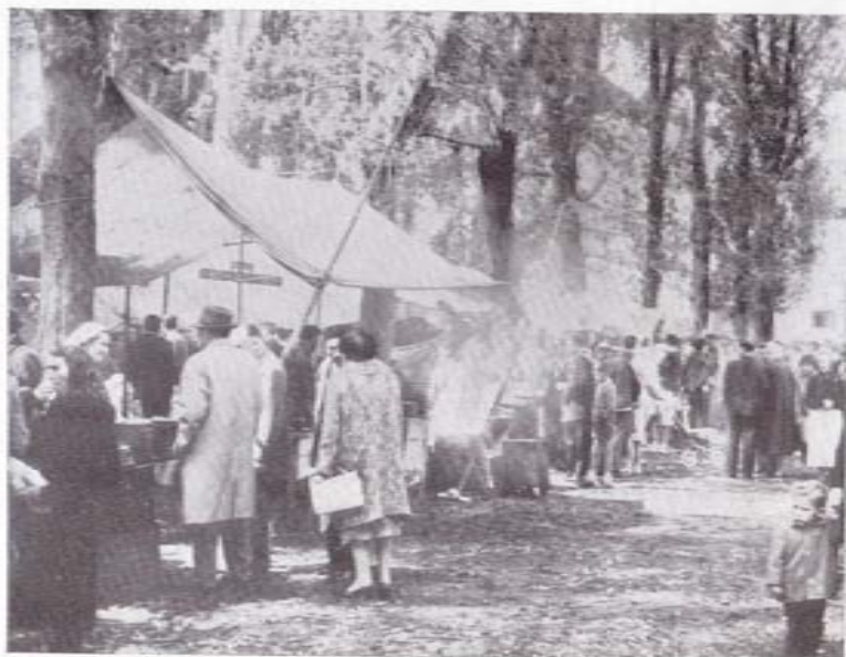
Las pulperías del Souto

Las fiestas padronesas tienen algo más trascendental que lo festivo y alegre, algo más que calesitas, juegos de tiro, etc., tienen fundamentalmente importancia vital, en lo que se refiere a la economía gallega.